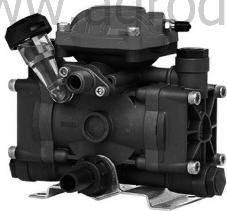
Рис. 3. Насос.