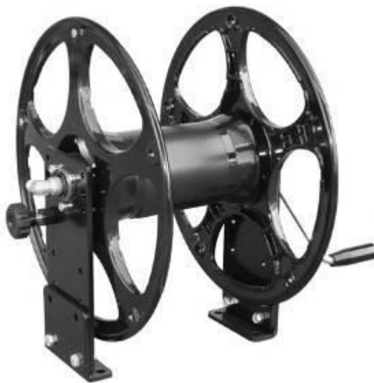
Рис. 7. КАТУШКА.

1. Ручка. 2. Штанга. 3. Распылитель. 4. Вариант специальной комплектации