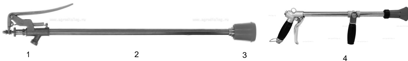
Рис. 6. Брандспойт.

1. Ручка. 2. Штанга. 3. Распылитель. 4. Вариант специальной комплектации